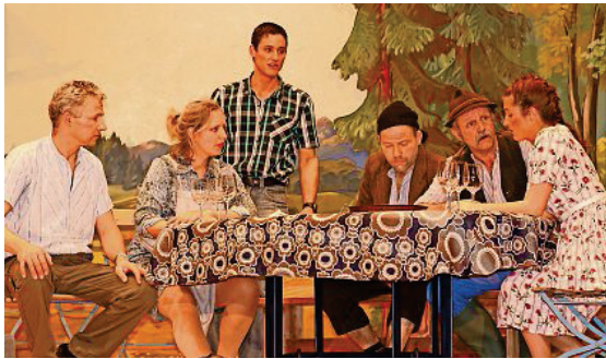
Starke schauspielerische Leistung vor schönem Bühnenbild z.Vg.