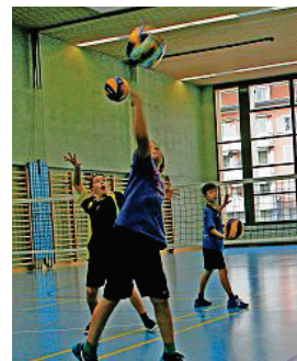
Bellebter Verein: Volley Flawil z.Vg.

Volleyball Bei Volley Flawil wird nicht mit trockenen Übungen, sondern variantenreich und spielerisch trainiert. Weil Volleyball wie andere Ballsportarten eine Teamsportart ist, legen die Trainer und die Verantwortlichen vom Vorstand auch grossen Wert auf Teambildung. Letztlich ist nur ein harmonisches Team fähig, auf dem Feld erfolgreich zu spielen. Volley Flawil ist ein